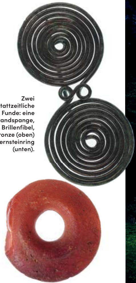
Zwei hallstattzeitliche Funde: eine Gewandspange, genannt Brillenfibel, aus Bronze (oben) und ein Bernsteinring (unten).

Die Liebe zum Schreiben ist bei mir älter als die Liebe zur Archäologie. Romane zu verfassen, war schon immer ein Traum für mich, und schließlich hat es sich einfach so ergeben. Dass Frauen bei mir im Zentrum stehen, ist klar, denn ich tue mir schlichtweg leichter, wenn ich aus ihrer Perspektive schreibe. Mir ging es aber nicht darum, den in vielen Büchern vorherrschenden männerdominierten Blick einfach umzukehren. Bei mir sind alle relativ gleichberechtigt. Es gibt mächtige Frauen und mächtige Männer ebenso wie weniger mächtige Männer und weniger mächtige Frauen. Natürlich brauchen Geschichten auch Konflikte, aber ich wollte eine Gesellschaft zeigen, in der Frauen ganz normal mitentscheiden dürfen und wichtige Rollen spielen, ohne ein großes Aufheben darum zu machen. Gleichzeitig verwende ich darin Inhalte aus der Archäologie, die einem aber nicht – wie in einem Geschichtsbuch – direkt ins Auge springen sollen. In jedem Buch gibt es am Ende eine Erklärung, die