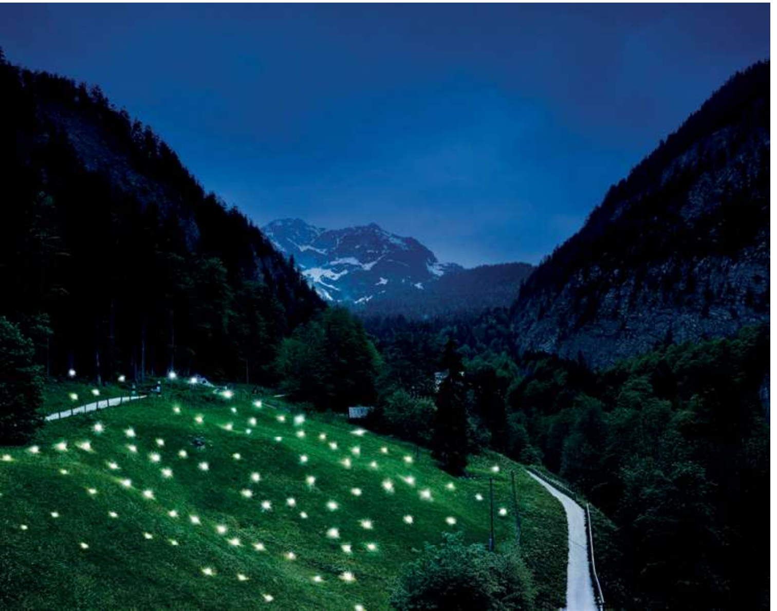
Eines der Gräberfelder von Hallstatt liegt im Hochtal am Salzberg. Sowohl auf der Wiese als auch im angrenzenden Wald entdeckten Forscher:innen mehr als 1.000 Gräber aus keltischer Zeit.

es den Leser: innen ermöglicht, die geschichtlichen Hintergründe besser zu verstehen.